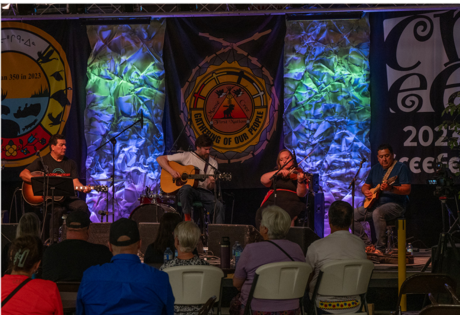
Concierto transatlántico «Nipin Celebration» 2023.

La iniciativa More than 350 surgió como respuesta a esta oportunidad