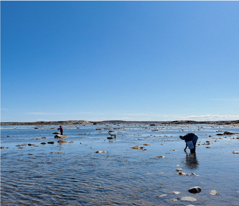
Recolección de uviluit —mejillones— durante la marea baja. Kuujjuaarusik, región de Kuujjuaq, agosto de 2023.

Por Allie Miot-Bruneau (Université Laval)