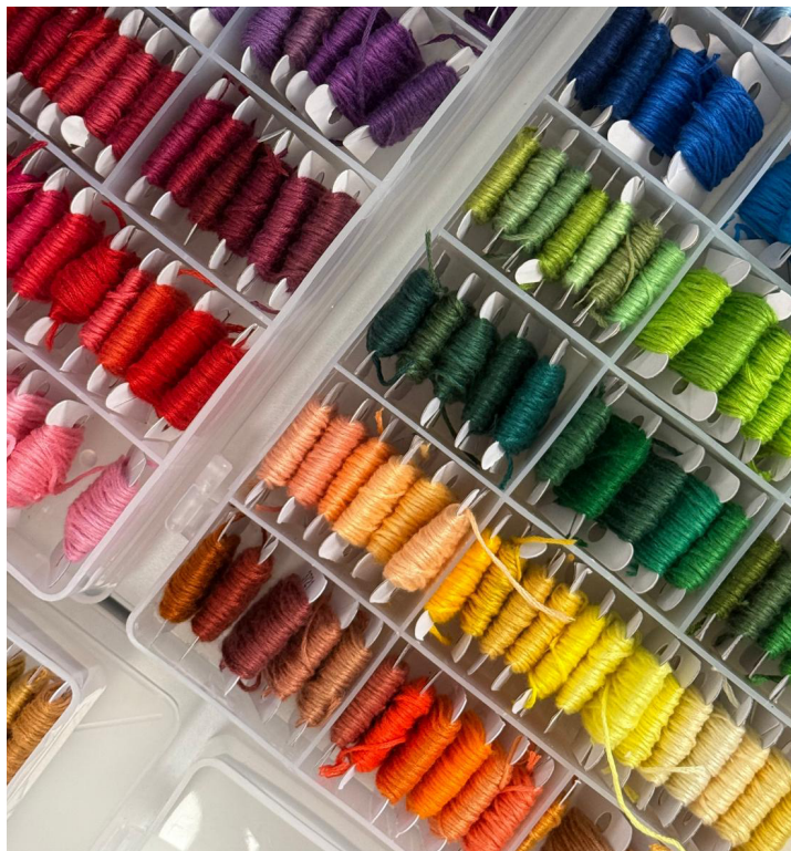
Una gama de posibilidades: los hilos de colores utilizados en el taller.