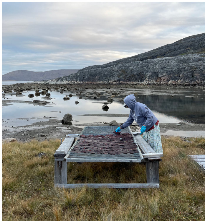
Una mujer de Kangiqsujuaq preparando nikkuk —carne seca de beluga—. Cerca de Kangiqsujuaq, agosto de 2025.

Desde sus roles en la educación y la transmisión cultural dentro de sus familias, pasando por su participación comunitaria para fomentar la presencia en el territorio, hasta sus diversos cargos en organizaciones regionales, su contribución es esencial y con frecuencia ocurre en espacios menos visibles que aquellos ocupados por los hombres. Las mujeres nunavimmiut que conocí ponen en práctica, en distintos niveles, un modelo de gobernanza inclusivo y relacional, que reconoce plenamente las colaboraciones y relaciones propias de los mundos indígenas.