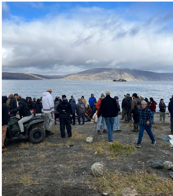
Encuentro en la playa de Kangiqsujuaq durante una jornada organizada por mujeres del comité cultural local, con ocasión de la asamblea general anual del Consejo Juvenil Qarjuit. Kangiqsujuaq, septiembre de 2025.

Recolección de paurngait —camarinas negras— y kigutangirnait —arándanos—. Kuujuaarusik, región de Kuujuaq, agosto de 2023.