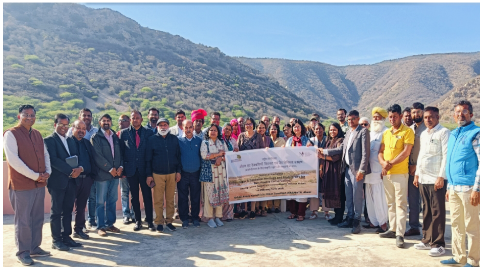
Los participantes se reunieron para hacerse una foto de grupo durante el Taller Nacional sobre Orans.

La segunda sesión abordó los estudios ecológicos y de biodiversidad sobre los Orans. Las discusiones destacaron su riqueza ecológica y la necesidad de estrategias de conservación y restauración basadas en evidencia científica. También se reafirmó que fortalecer la investigación ecológica, integrar el conocimiento tradicional e invertir en infraestructura para la restauración son acciones fundamentales para sostener los Orans como núcleos resilientes de biodiversidad en los paisajes secos de India. Además, se enfatizó que combi-