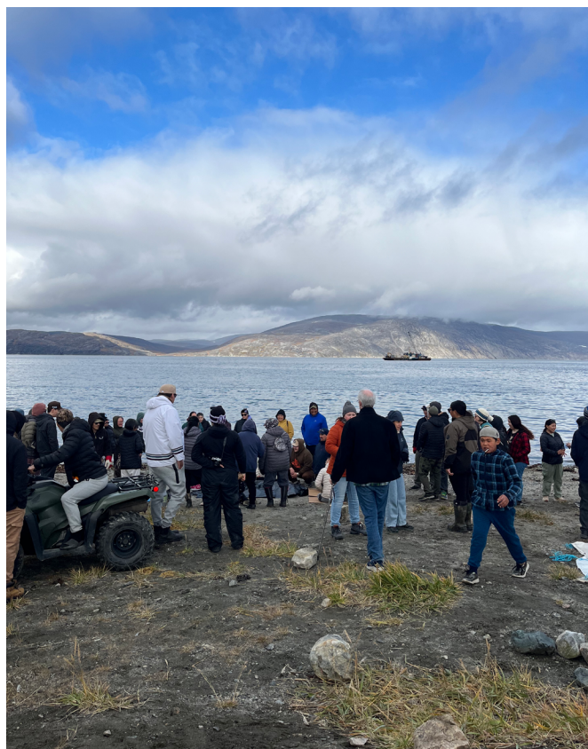
Rassemblement sur la plage de Kangiqsujuaq lors d'une journée organisée par les femmes membres du comité culturel local, à l'occasion de l'assemblée générale annuelle du Conseil jeunesse Qarjuit. Kangiqsujuaq, septembre 2025.