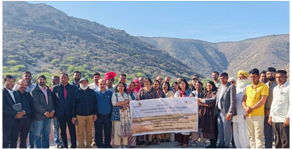
Les participant-es se sont réuni-es pour une photo de groupe lors de l'atelier national sur Orans.

La première session technique était consacrée aux cadres politiques et juridiques propres à la conservation des orans (bosquets sacrés). Elle a réuni des expert-es juridiques, des chercheur-ses et des praticien-nes afin d'examiner de manière critique l'évolution de la jurisprudence et du paysage politique concernant les bosquets sacrés conservés par les communautés. La session a souligné que le renforcement de la clarté juridique, l'amélioration de la coordination institutionnelle et la garantie des droits communs sont essentiels pour préserver l'avenir des Orans en tant que systèmes socio-écologiques vitaux. La deuxième session a porté sur la biodiversité et les études écologiques relatives aux Orans – bosquets sacrés. Les discussions ont mis en lumière la richesse écologique des Orans et ont insisté sur les stratégies fondées sur la science pour leur conservation et leur restauration. La session a réaffirmé que le renforcement de la recherche écologique, l'intégration des savoirs traditionnels et l'investissement dans les infrastructures de restauration sont essentiels pour préserver les Orans en tant que points chauds de biodiversité résilients dans les paysages des zones