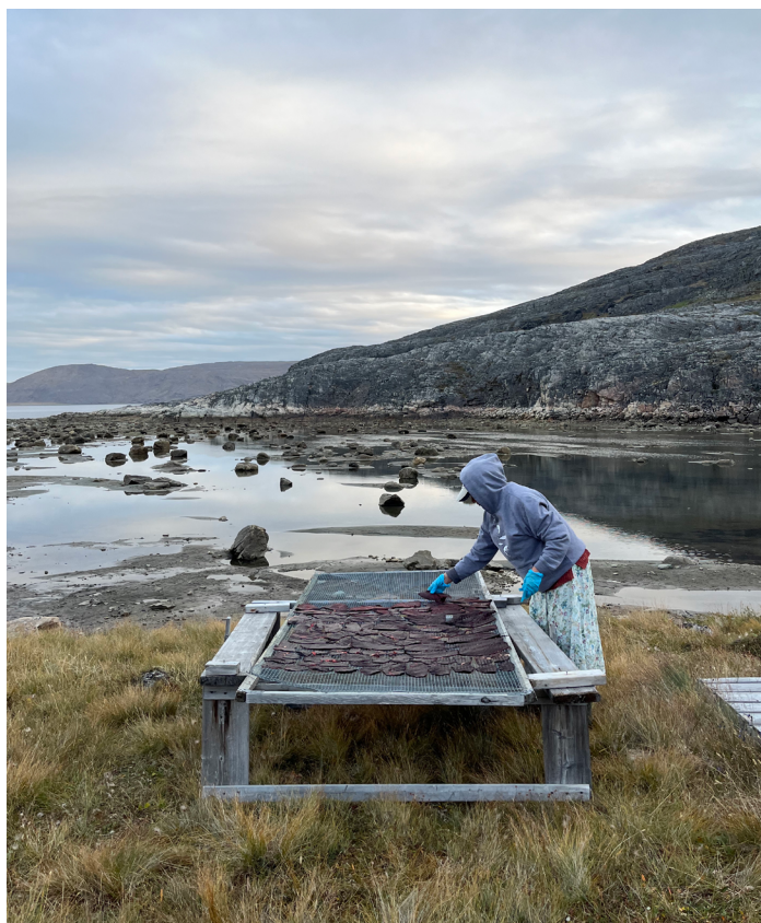
Une femme de Kangiqsujuaq en train de préparer du nikkuk (de la viande séchée de béluga). À proximité de Kangiqsujuaq, août 2025.

de gouvernance inclusif et relationnel, qui laisse toute leur place aux collaborations et aux relations caractéristiques des mondes autochtones.